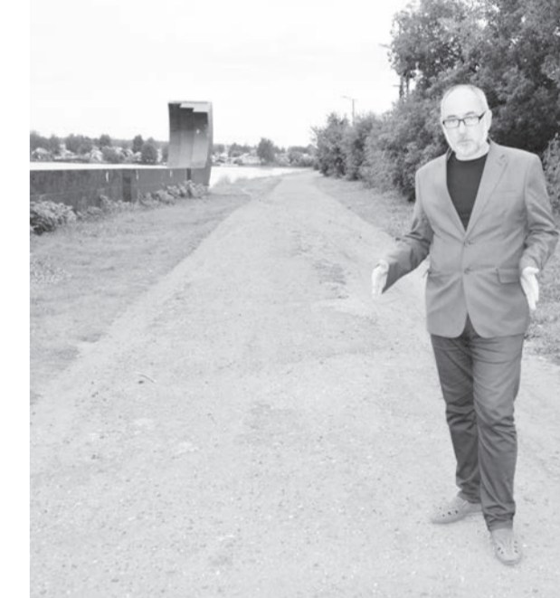
● Плотина Верхнего пруда среди заводских — одна из самых больших

— Мы идём вдоль Верхнего пруда по плотине длиной 600 метров. Она небольшая, если сравнивать с другими построенными для местных заводов. Зато высота её — 6 метров. За прудом располагались районы Голявка и Скотный, где жили малообеспеченные люди и скотники. В верхней Выксе жили богатые люди либо те, кто работал на Верхнем Выксунском заводе, по-