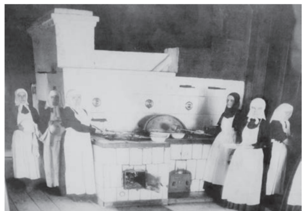
● Благодаря тому что фотографирование было послушанием одной из монахинь, мы можем многое узнать о прежней жизни обители