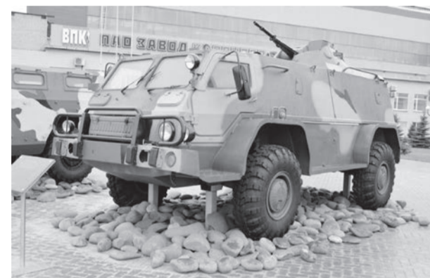
● Здесь же находится модель ГАЗ «Водник», не пошедшая в массовое производство...