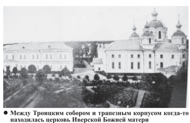
● Между Троицким собором и трапезным корпусом когда-то находилась церковь Иверской Божией матери