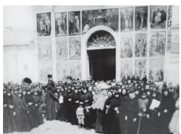
● По некоторым данным, Троицкий собор вмещал до 5000 человек

К сожалению, восстановить Иверский монастырь в прежних пределах не представляется возможным. В том числе потому, что некоторые постройки сейчас являются личной собственностью или жилыми зданиями. Восстановительные работы ведутся интенсивно: одновременно реставрируются несколько зданий, пострадавших в советское время.