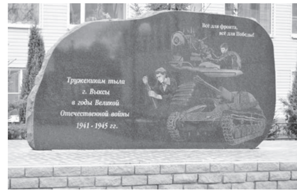
● Памятник труженикам тыла

Недавно на площадке появился «Водник» — одна из экспериментальных моделей предприятия. В производство она не пошла, но наработки по ней используются в других проектах.