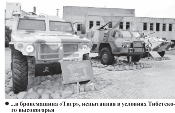
● ...и бронемашинка «Тигр», испытанная в условиях Тибетского высокогорья

«Тигр» стоит на вооружении Российской армии. Он разработан в начале 2000-х годов. Образец, который здесь представлен, прошёл испытания в Тибете, проехав по высокогорью почти 10 000 км.