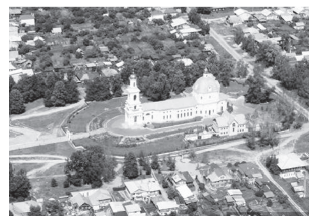
● Большая церковь раньше стояла на полуострове