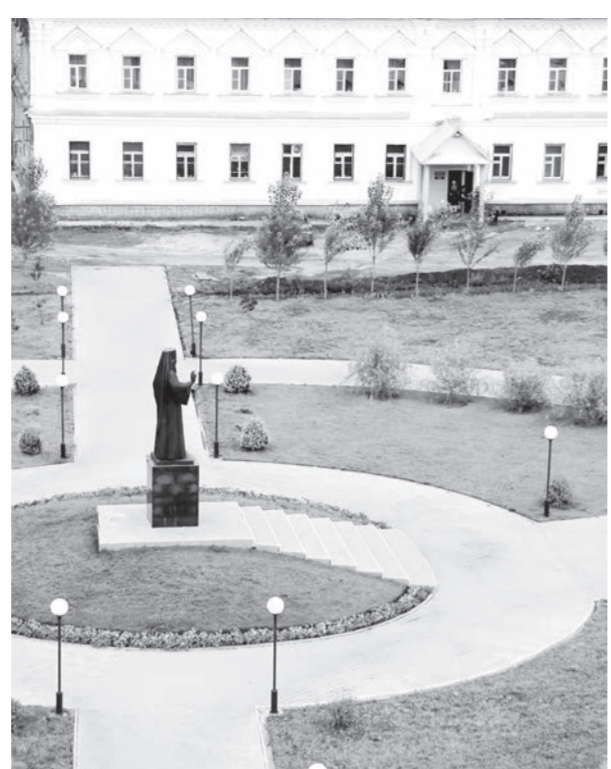
● В центре Иверского сквера стоит памятник преп. Варнаве Гефсиманскому