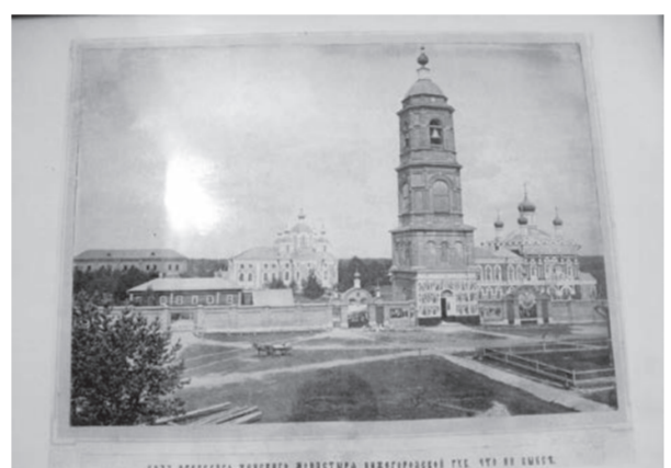
● Фотографии Иверской обители хранятся в монастырском музее

Кстати, из кирпича разобранной после революции монастырской стены построено здание нынешнего ДК имени И. И. Лепсе. В тот же период был взорван Троицкий собор. Наверное, не многие знают, что между Троицким собором и трапезным корпусом располагалось ещё одно здание — церковь Иверской Божией матери. Сейчас на этом месте находится памятный крест. По преданию, когда разрушался этот храм, несколько монахинь ушли в его подвалы и были взорваны вместе с ним.