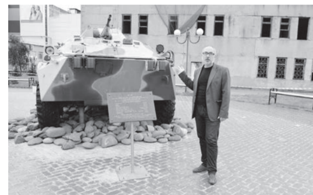
● На площади перед заводом корпусов представлен БТР-80

— Мы находимся на площади перед заводом корпусов, где гостей нашего города встречают единственный в городе памятник труженикам тыла и образцы техники, производимой на предприятии (справа на вьезде). Первые два объекта — БТР-80 и «Тигр», массово выпускаемые виды техники. Востребованы не только в России, но и за рубежом. Советские БТРы — первые в мире плавающие бронетранспортёры. Обратите внимание на специфический наклон брони, разработанный специально для того, чтобы пули и осколки ricochetили.