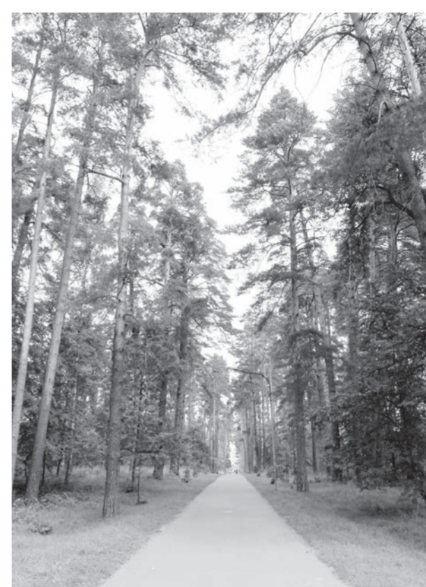
● Уникальность выксунского парка — в сочетании французского и английского стилей